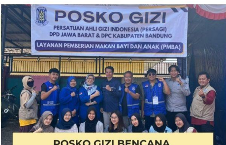
POSKO GIZI BENCANA DI BANDUNG TAHUN 2024