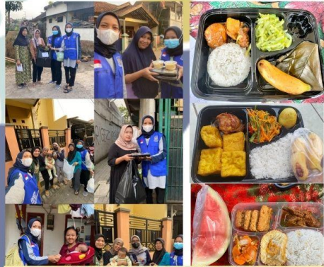
PEMBUATAN DAPUR PMBA BENCANA BANJIR SUMEDANG TAHUN 2025 (DPC PERSAGI SUMEDANG)