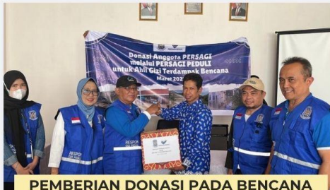
PEMBERIAN DONASI PADA BENCANA BANJIR DI BEKASI TAHUN 2025