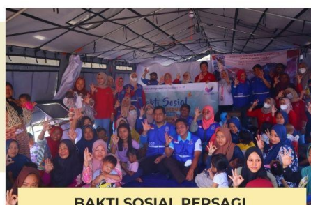
BAKTI SOSIAL PERSAGI GEMPA CIANJUR TAHUN 2023