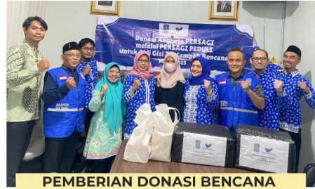
PEMBERIAN DONASI BENCANA BANJIR DI TANGERANG TAHUN 2025