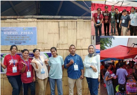
PEMBUATAN DAPUR PMBA BENCANA ERUPSI GUNUNG LEWOTOBI LAKI - LAKI TAHUN 2025 (DPC PERSAGI FLORES TIMUR)